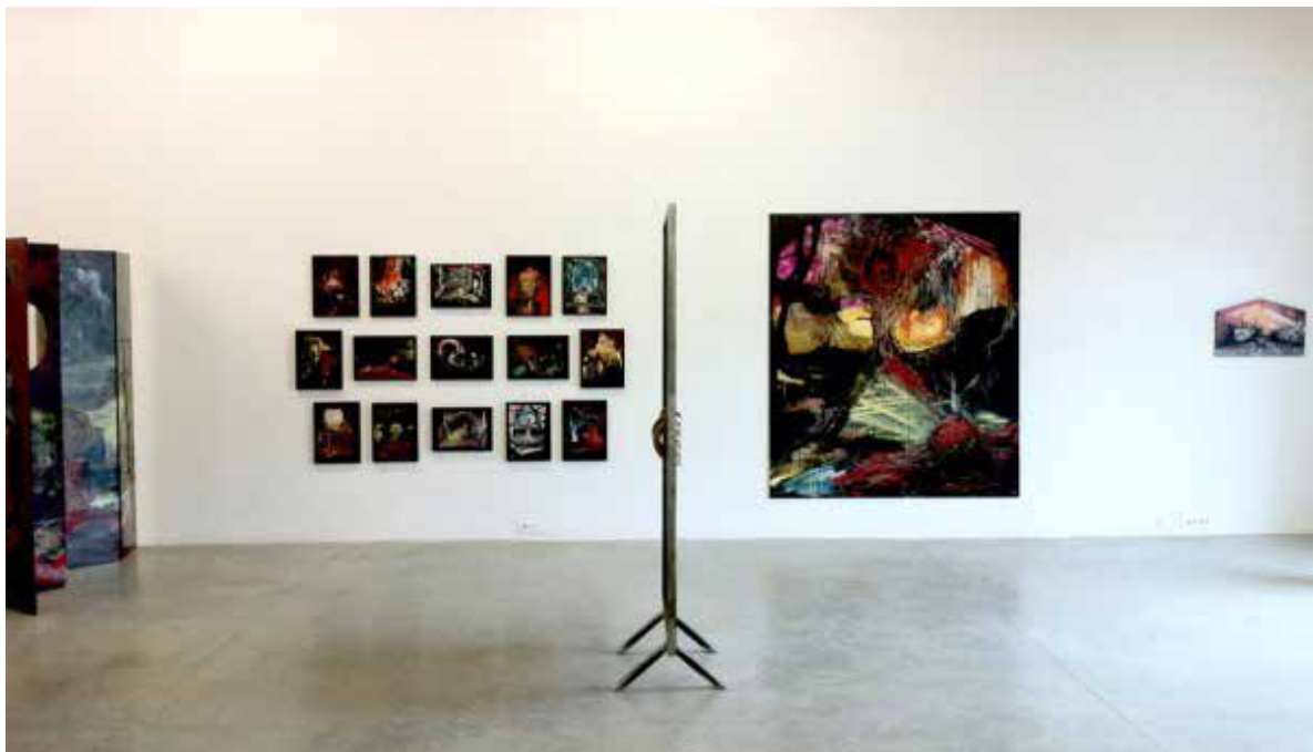
Vue de l'exposition Heureux les fêlés car ils laisseront passer la Lumière 2012, Galerie Houg, Lyon

Cristine Guinamand est une artiste internationale. Dès ses premières années d'études, elle cherche à rencontrer d'autres cultures, d'autres esthétiques, en partant en échange à l'École des Beaux-Arts de Porto. En 2001, elle participe au 46ème salon d'art contemporain de Montrouge et exporte ses oeuvres en Catalogne et au Portugal. Son exposition "La peinture est derrière nous" voyage entre 2010 et 2013 à Istanbul, Maribor (Slovénie) et Los Angeles.