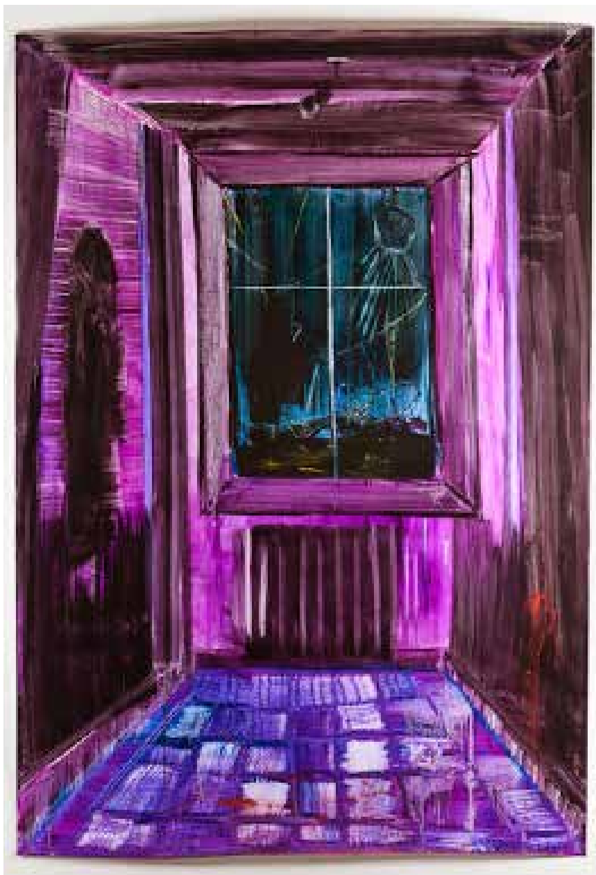
Cristine GUINAMAND, Intérieur violet 2012, huile sur papier, 155 x 108 cm

Les intérieurs reprennent la construction de la gravure de Dix et varient en couleurs, vives, saturées, ils recueillent comme des flashes lumineux la lumière du dehors. Une lumière atomique, une lumière de fin du monde. Stéphane Pencrearc'h, Espaces Intranquilles