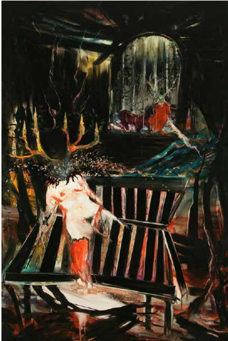
Cristine guinand, Coupable d'obscurité 2009, huile sur toile, 195 x 130 cm Collection particulière