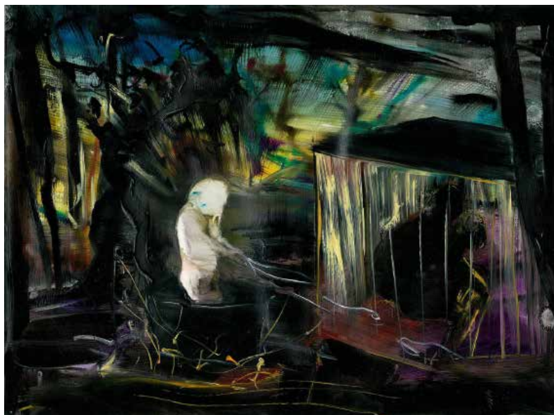
Cristine GUINAMAND Les possédés 2009 huile sur papier marouflé sur toile 29,7 x 42 cm