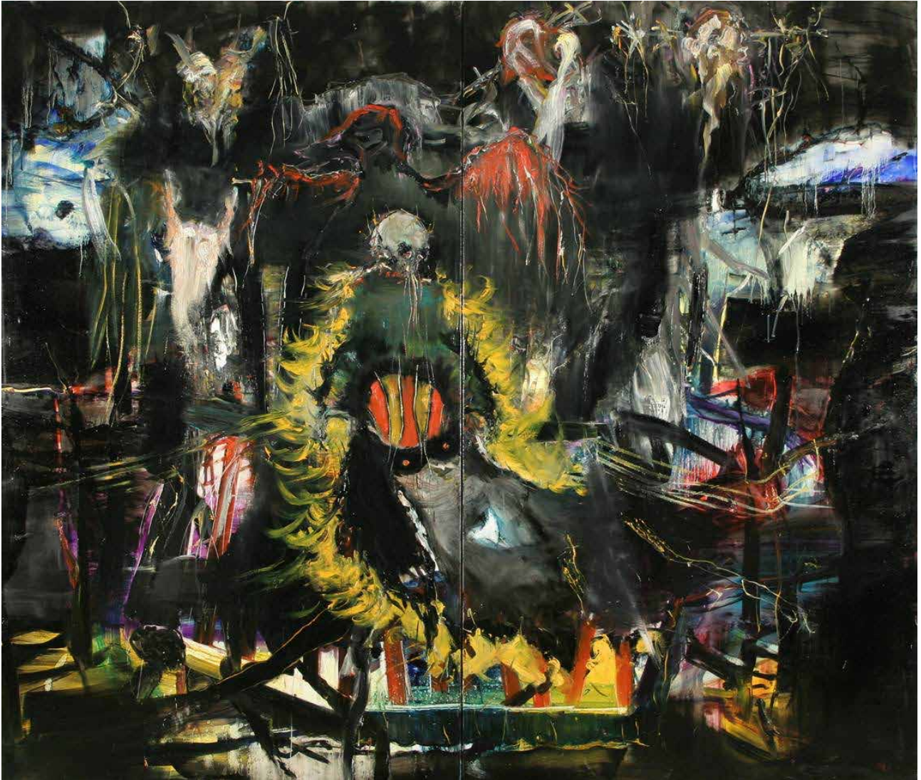
Cristine GUINAMAND, L'obscur prétendant 2009, dypique, huile sur toile, 228 x 195 cm Collection de l'artiste